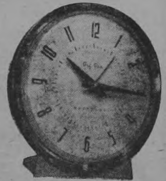
Escoja hoy mismo su despertador WESTCLOX del amplio surtido y modelos que tenemos a su disposición.

Universal CARLOS FEDERSPIEL & CO. S. A. Y SUS DISTRIBUIDORES PHILIPS EN TODO EL PAIS