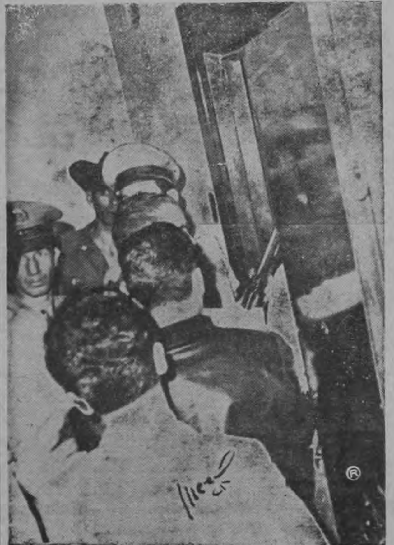
MOMENTOS DE EXPECTACION — La policía se dispone a entrar en la bóveda que guarda millones entre efectivo y valores de la Institución. Uno de los cajeros la había cerrado violentamente poco después de haber sido herido el Jefe de Cajeros, y se presumía que por lo menos uno de ellos se encontraba adentro. Un miembro de la fuerza pública sostiene una ametralladora en sus manos, listo para entrar en acción. Pronto se comprobó que no había nadie en la bóveda, y que NINGUNO DE LOS VALORES HABIA SIDO ROBADO.