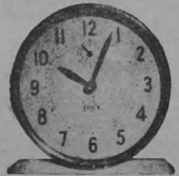
El Jock, otro reloj Westclox, de fama ganada por su prestigio y gran calidad.

Regale puntualidad, exactitud y además calidad, recuerde, lo mejor es WESTCLOX