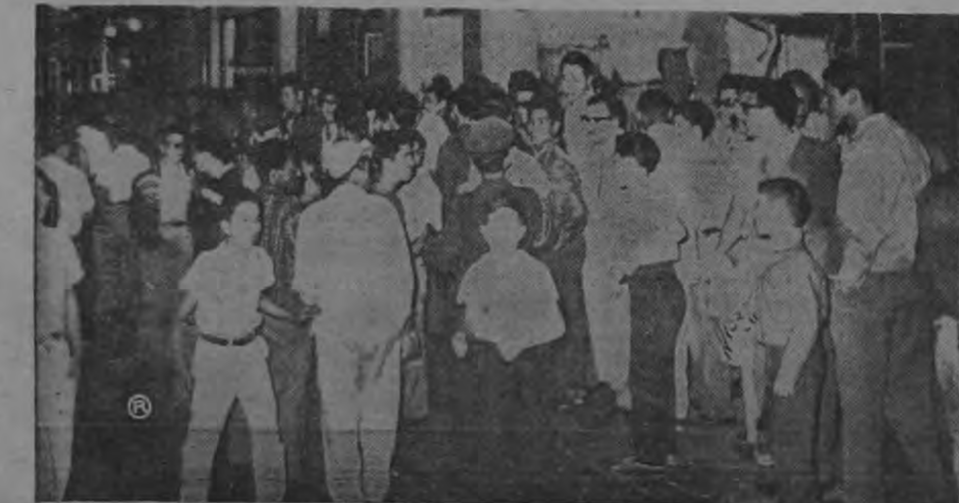
LOS CURIOSOS DE SIEMPRE — Multitud de gente que no quería perderse ningún detalle del suceso, se arremolinó frente a las oficinas de la Caja Costarricense del Seguro Social, dificultando grandemente la acción de las autoridades. Allí se mantuvieron desde las 5 de la tarde, hora en que aproximadamente el asunto trascendió, hasta medianas horas de la noche. (Foto Meza).